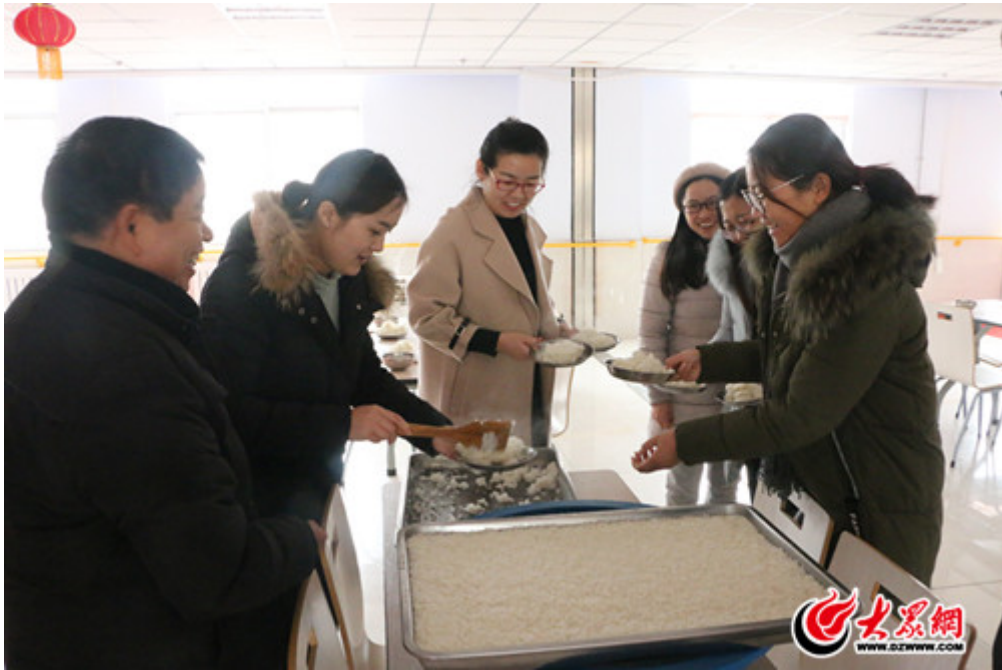
天同食品的工作人员在食堂帮忙盛饭菜

看见食堂的工作人员要给老人们盛饭菜，天同食品的义工们纷纷上前帮忙。不一会儿，老人们就结伴来到了餐厅，坐到餐桌前开始吃午饭。天同食品的工作人员一边帮忙盛饭菜，一边和老人聊起家常，询问他们的身体、生活情况。