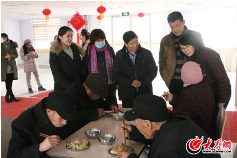
天同食品工作人员和老人聊起家常，询问他们的身体、生活情况

有些老人因身体原因下不了床，食堂的工作人员将饭菜送到了他们的房间。天同食品的领导来到他们的床头，了解他们的住宿、身体情况，还帮助行动不便的老人打开水、送茶等。