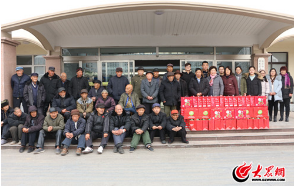
天同食品工作人员与九曲中心敬老院的老人们合影留念

大众网临沂 12月24日讯（记者 刘元迪）12月23日，在元旦即将来临之际，山东天同食品有限公司走进临沂市河东区九曲中心敬老院，将黄桃、草莓罐头等水果产品送到了86位老人手中，让老人们感受到了社会爱心的温暖。