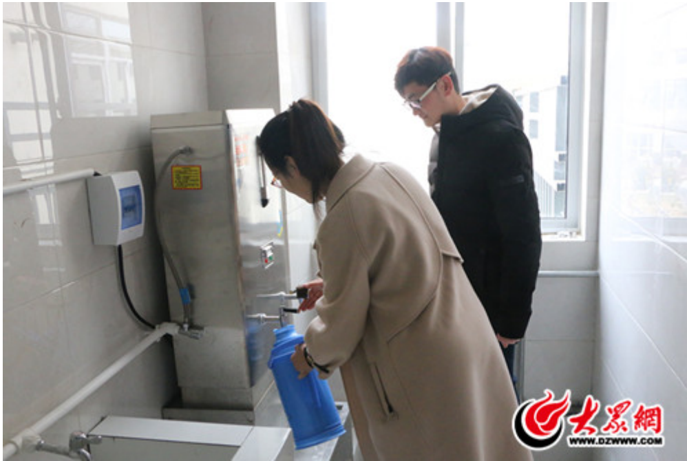
帮助行动不便的老人打水

http://a.mini.eastday.com/a/171224105007448.html