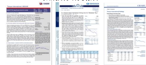
信達國際 國泰君安證券 高誠證券

2019年全年業績後，信達國際、高誠證券及國泰君安證券發表最新的天韻國際研報，評級為買入，目標價分別是港幣1.45元、1.56元及1.4元。