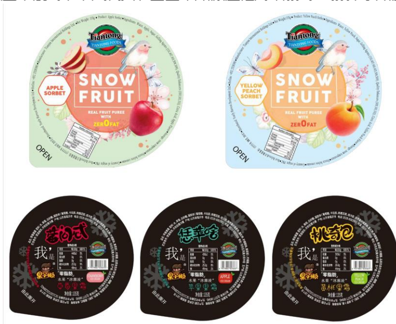
首批於國內及港澳市場投放的產品即將量產