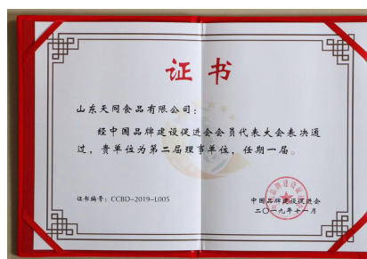
天同食品當選第二屆理事單位